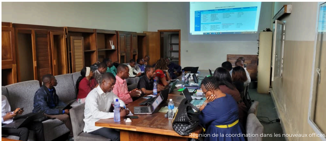
Réunion de la coordination dans les nouveaux offices

CONSOLIDER LA SOUVERAINETÉ SCIENTIFIQUE PAR L'INNOVATION ET LA VALORISATION