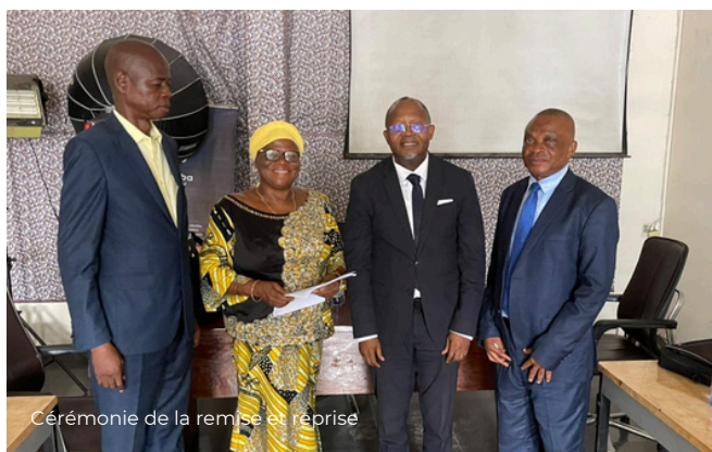
Cérémonie de la remise et reprise