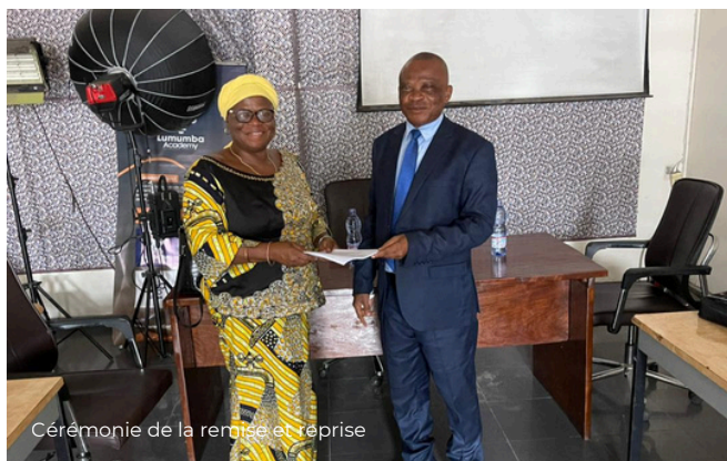
Cérémonie de la remise et reprise

Cette cérémonie s'est déroulée sous la supervision des inspecteurs mandatés par le Secrétariat Général du RSIT.